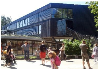
Paleis (groepen 4 en 5)