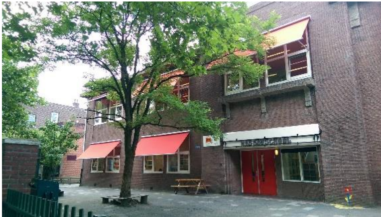
Groepen 6, 7 en 8

Nassaulaan 5 9717 CE Groningen Tel: 050 3180436