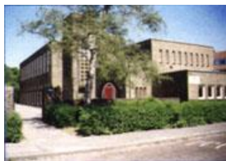
Monument (groepen 2 en 3)

www.nassauschool.nl info@nassauschool.nl