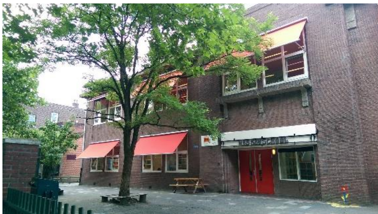
Groepen 6, 7 en 8

Nassaulaan 5 9717 CE Groningen Tel: 050 3180436