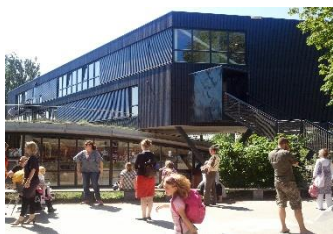
Paleis (groepen 4, 5 & 5/6)