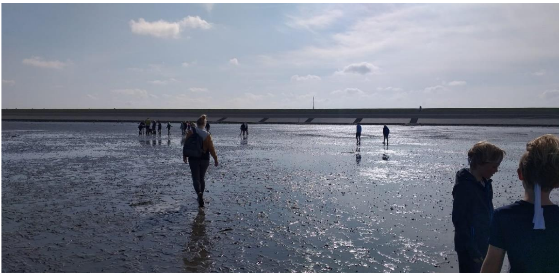
De groepen 6 genoten van het wadlopen in Lauwersoog

De groepen 2 tot en met 8 zijn afgelopen week allemaal op schoolreis geweest. Voor het eerst staan deze uitjes in september gepland, mede mogelijk gemaakt dankzij corona... Maar eigenlijk wel een heel mooi en passend moment, aangezien we op dit moment, aan het begin van het schooljaar, extra investeren in een goede en veilige sfeer in de groep en dit sluit hier naadloos bij aan.