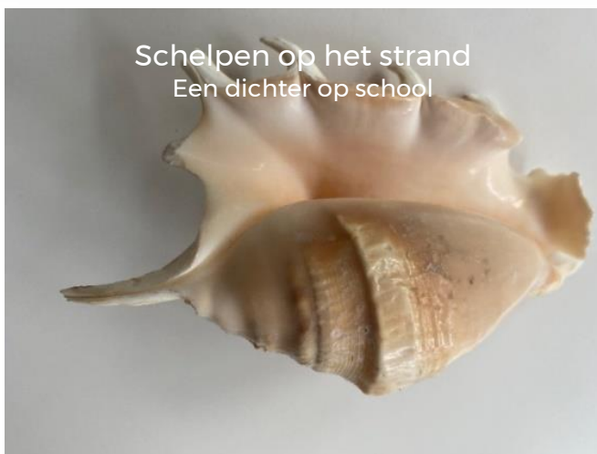
Schelpen op het strand Een dichter op school